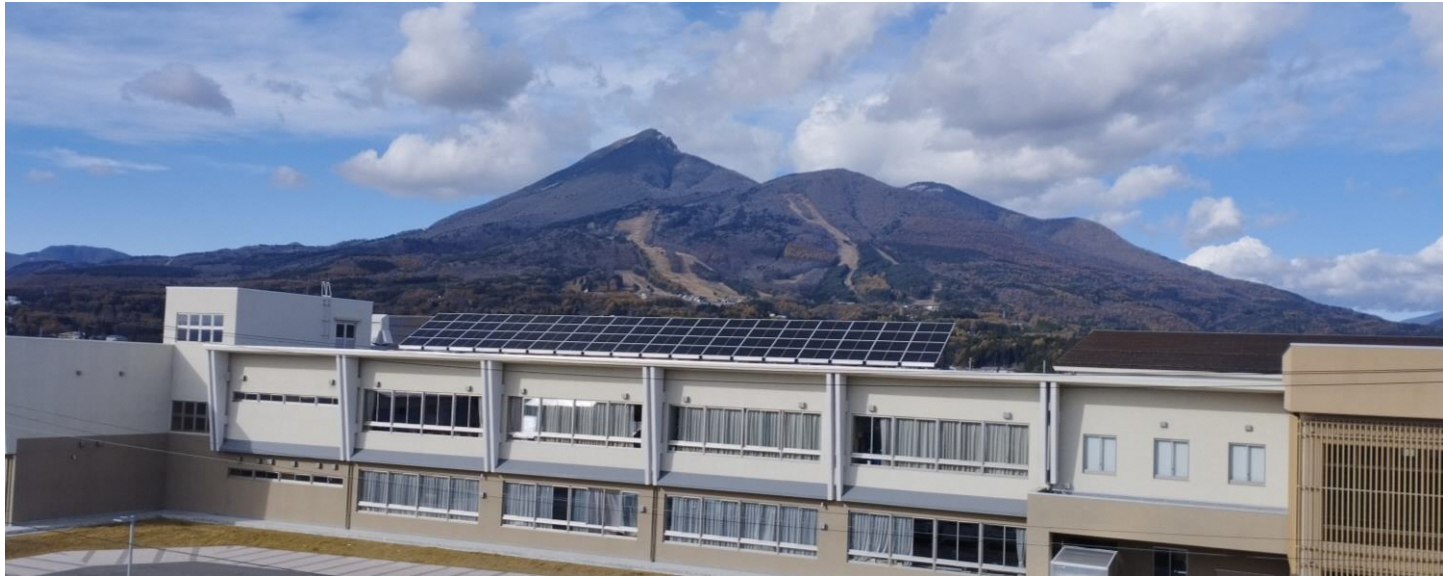
猪苗代町立猪苗代中学校 太陽光発電設備 (24.12kW)