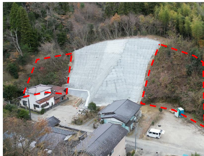
山ノ神（いわき市）法面工