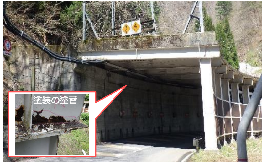
国道252号 滝原スノーシェッド (三島町)