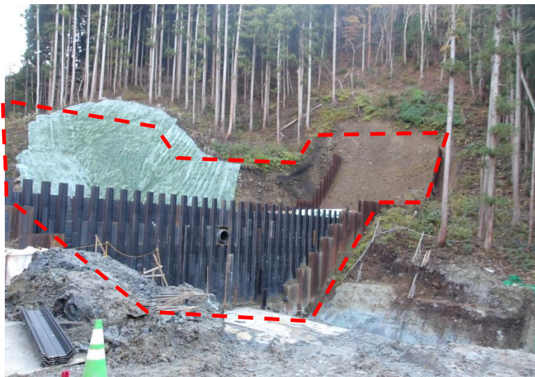
院内沢（会津若松市）砂防堰堤工