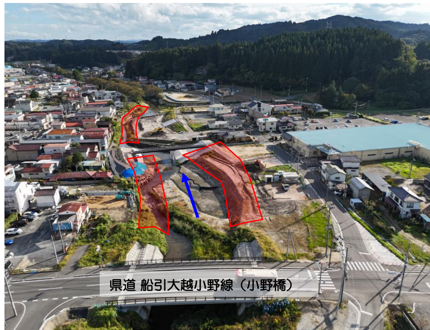
右支夏井川 (小野町) 築堤護岸工