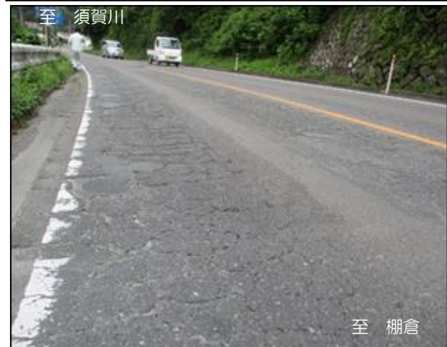
国道118号 長久保工区 (石川町)