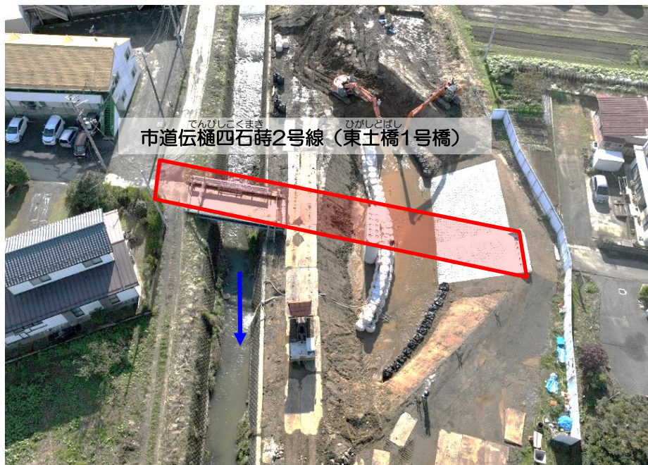
伝樋川 (伊達市) 橋梁上部工