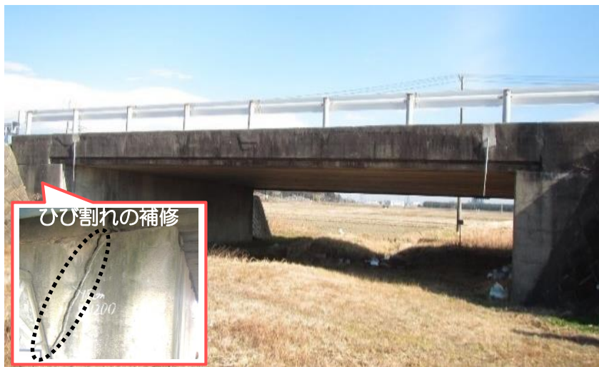
県道相馬新地線 山崎橋 (相馬市)