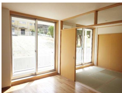
居間・食事室・和室2