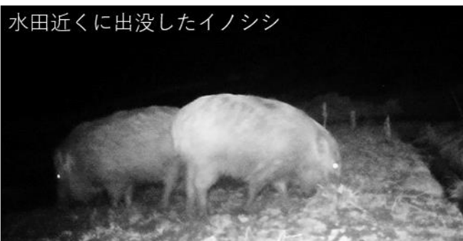
水田近くに出没したイノシシ

田村農業普及所では農地の鳥獣被害対策について支援しております。イノシシ被害対策として、電気柵の設置方法が分からない等ありましたら是非ご相談ください。