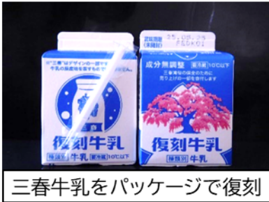
三春牛乳をパッケージで復刻