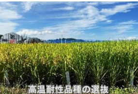
高温耐性品種の選抜