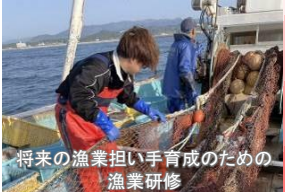
将来の漁業担い手育成のための漁業研修