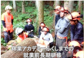
林業アカデミーふくしまでの就業前長期研修