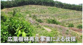
広葉樹林再生事業による伐採