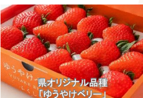
県オリジナル品種「ゆうやけベリー」