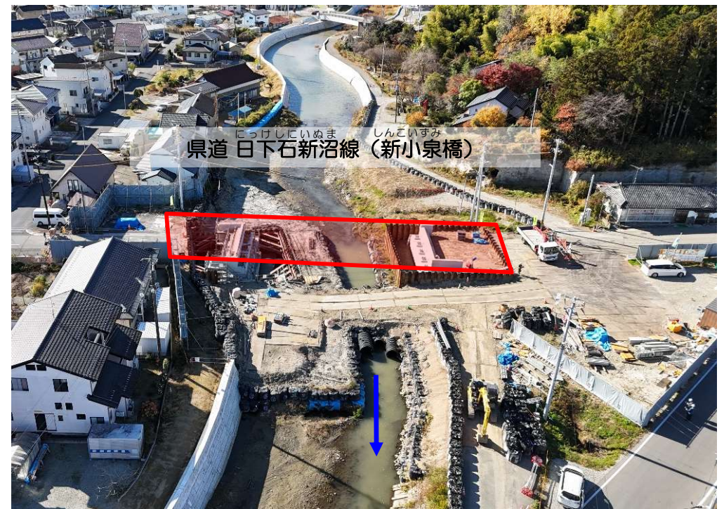
こいすみ 小泉川（相馬市）橋梁上部工