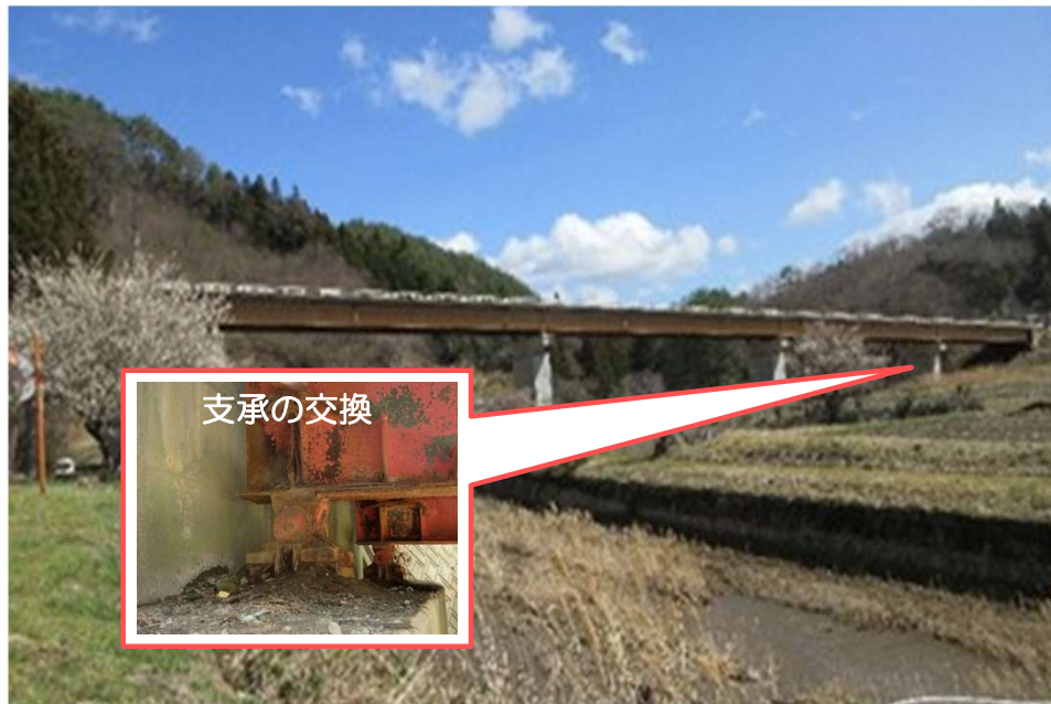
国道288号 みやこじ 都路大橋 (田村市)

【橋梁・トンネル・スノーシェッド等補修事業】補正額：11,664百万円 事業箇所：国道288号【都路大橋】外389箇所