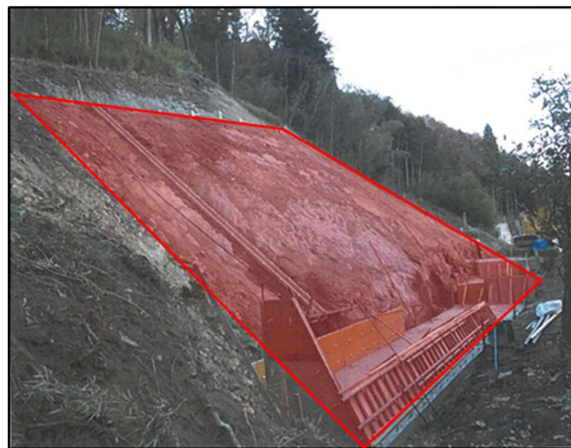
いいどう 飯土用（白河市）法面工