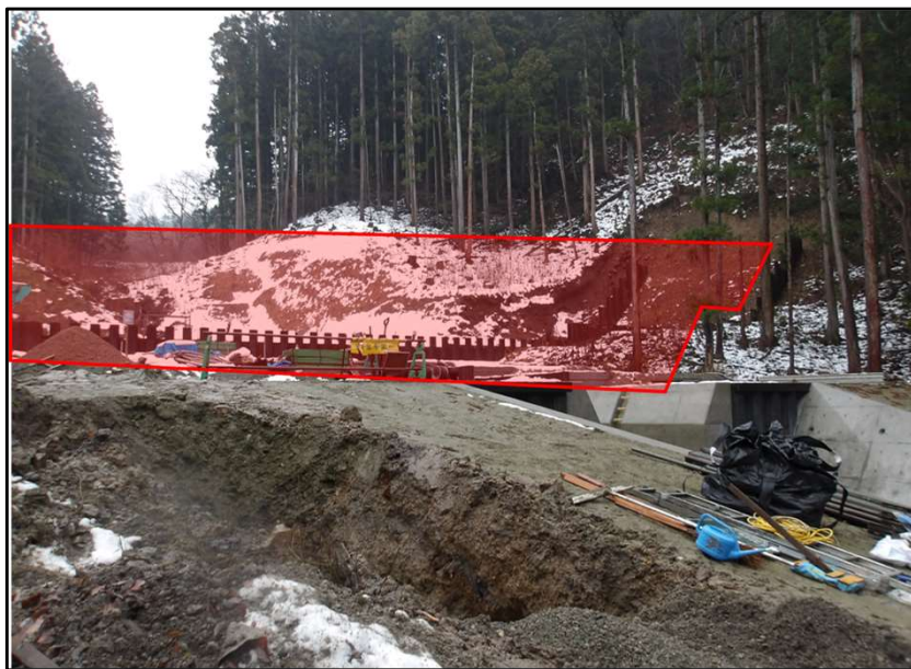
いんないさわ 院内沢（会津若松市）砂防堰堤工