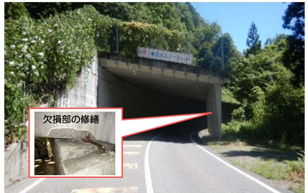
国道252号 たかしみず 高清水スノーシェッド (三島町)