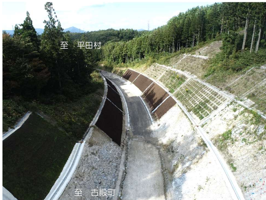
国道349号 榑坂工区 (平田村)

【① 道路改築事業】補正額：5,020百万円 事業箇所：国道349号【榑坂工区】外28箇所