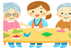
認知症サポーター 養成講座