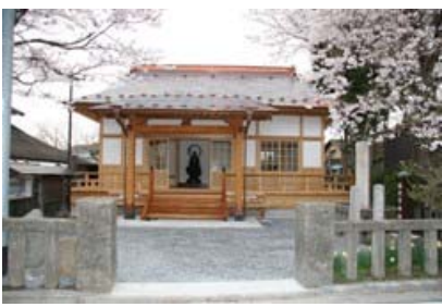
埴代官所跡(子育て地蔵尊)