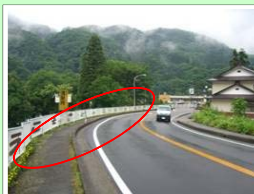
芦ノ牧橋の美化活動