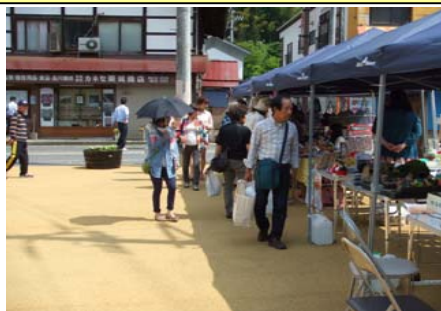
多目的広場の様子