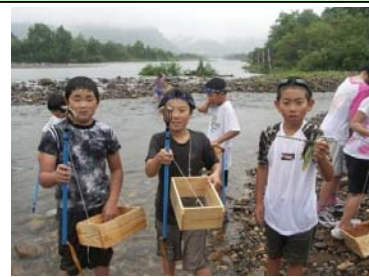
ふるさとふれあい教室