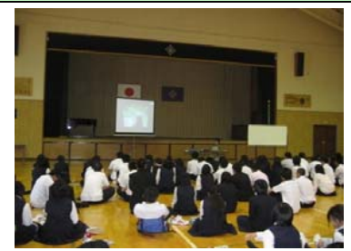
南会津高校で勉強会