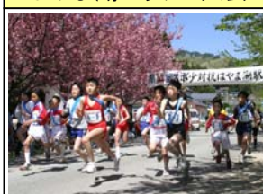
はやま湖マラソン大会