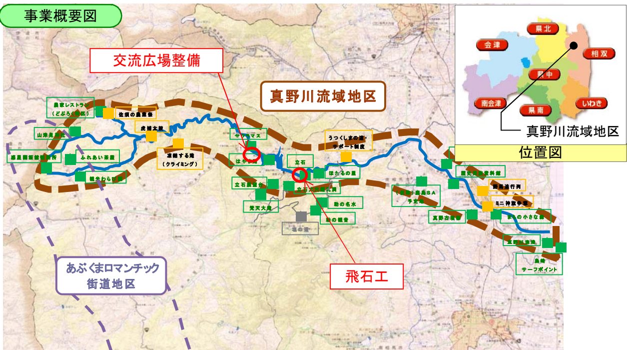
真野川流域地区 位置図