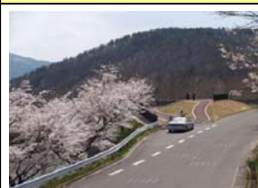
視点場からの眺望