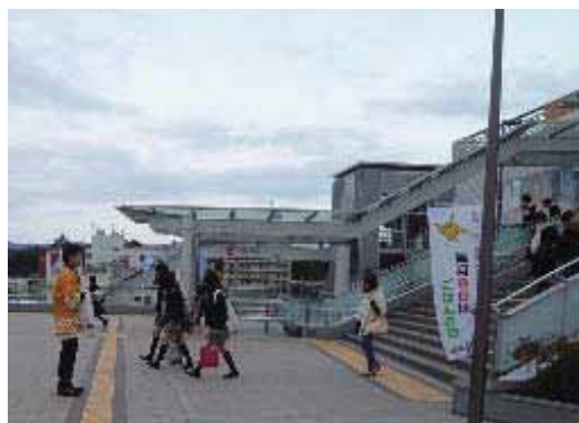
(JRいわき駅での街頭キャンペーンの様子)

キャンペーンは午前7時30分から約1時間、駅南口の駅前広場にのぼりを立てて、ごはんの日をPRするため、いわき農林事務所の職員がごはんの日のパンフレット、ごま塩のほか、ふりかけ3種、ポケットティッシュなどのPR用品を乗降する通勤・通学者に配布しました。