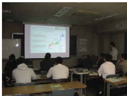
(作物研究所での研修の様子)

参加者たちは、熱心に質疑を行い、理解を深め、今回の視察研修で学んだことを今後の農業経営に役立てるとともに、会員相互間の連携を深めることにより、協議会のさらなる発展に繋げていきたいと意欲を高めていました。