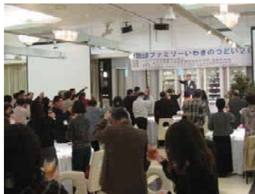
(地球ファミリーのつどいの様子)

今年は第8回目を迎え、認定農業者の方々は、見事に変身した農産物に舌鼓を打ちながら、消費者に野菜等の栽培や収穫できるまでの苦労などを説明し、文字