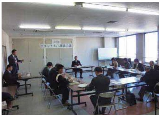
（グリーン・ツーリズム推進会議の様子）

2月23日（水）、県いわき合同庁舎において、平成22年度いわき地方グリーン・ツーリズム※推進会議を開催しました。