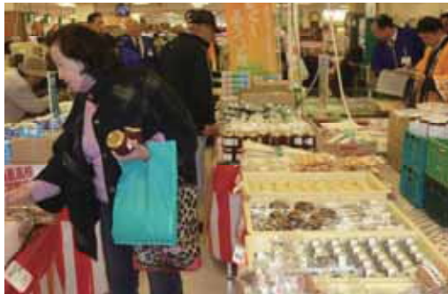
(6次化商品等を品定めする来店者)

会場では、消費者に6次化商品の味を実感していただくため、試食を行い、来店客は、商品の味を確かめながら、品定めしては買い物かごに入れていました。