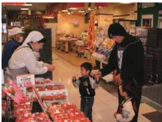
(量販店で試食&販売の様子)

いわき農林事務所では、福島県内だけで栽培されている、「ふくはる香」とその美味しさをより多くの方々に知っていただくために、今後もPR活動を継続していくこととしています。