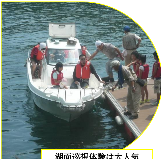
湖面巡視体験は大人気