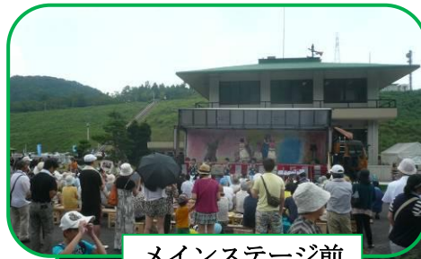
メインステージ前

「森と湖に親しむ旬間」H26. 7. 21~7. 31 (10日間) 「第19回四時ダムまつり」H26. 7. 27 (最終日曜日) が、開催されました。 ダムまつりには 2,500 人を超える人が訪れました。