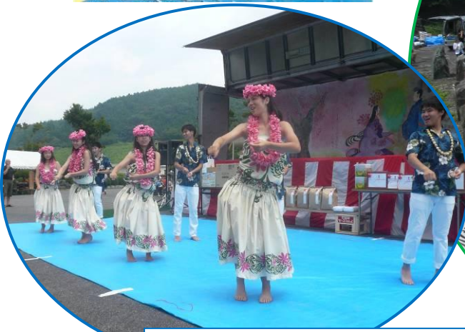
フラガール&ボーイ：勿来工業高校