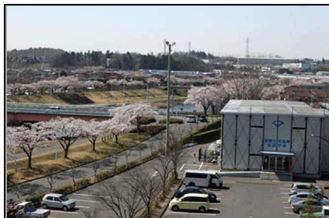
須賀川市役所仮設庁舎