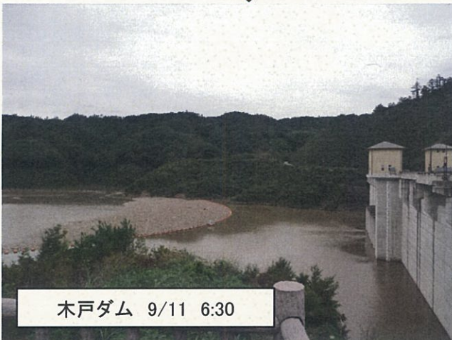
木戸ダム 9/11 6:30