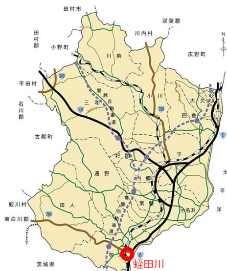
— 蛭田川的位置 —