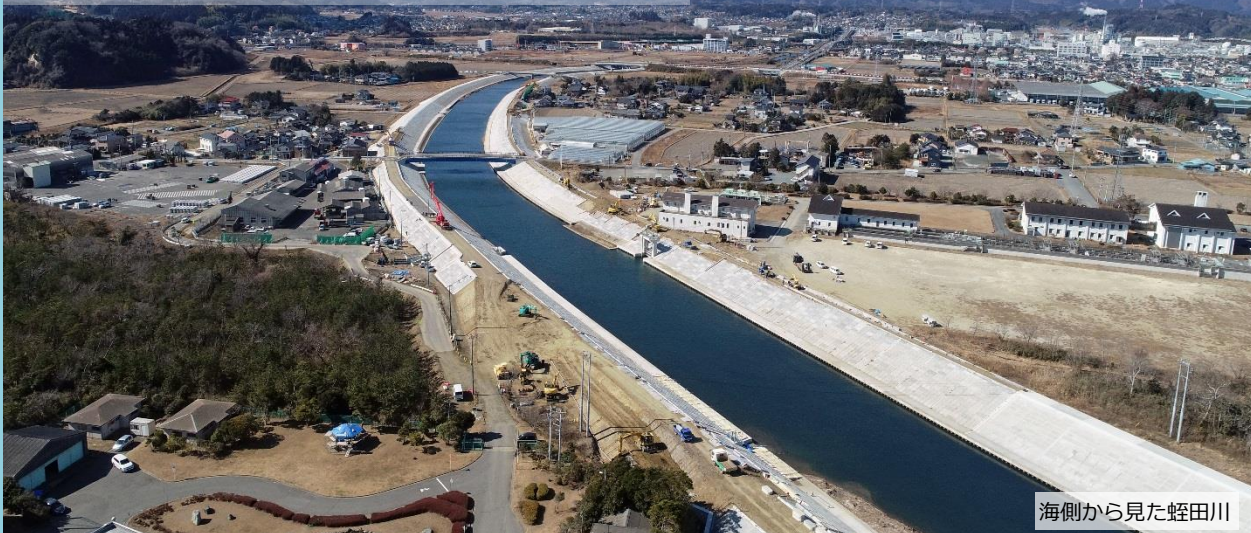
海側から見た蛭田川

青森県から来た応援職員 蛭田川の公共災害復旧工事を担う — 三年に渡って続く工事の完成を目指して —