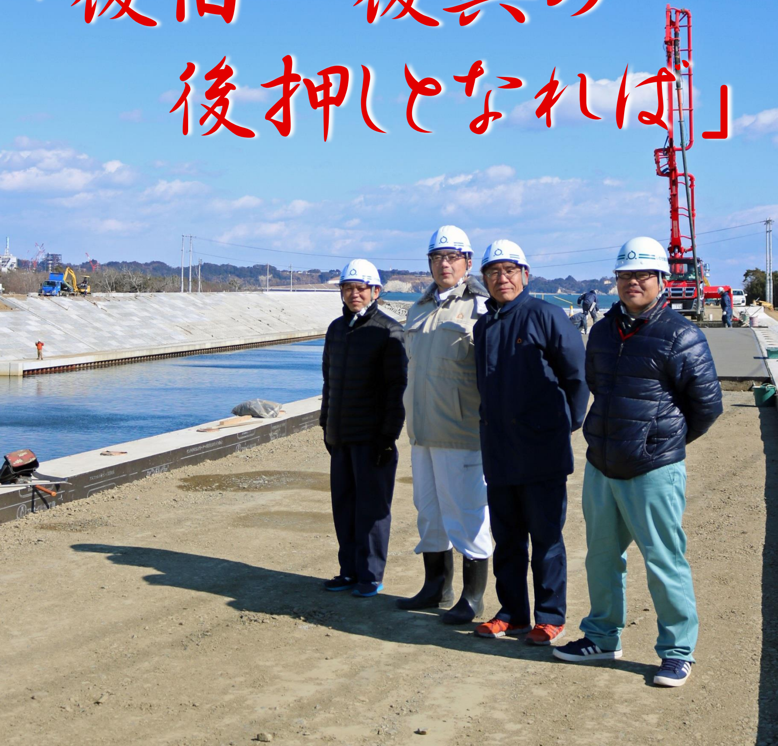
鹿児島県からの応援職員（左端） 青森県からの応援職員（右端）