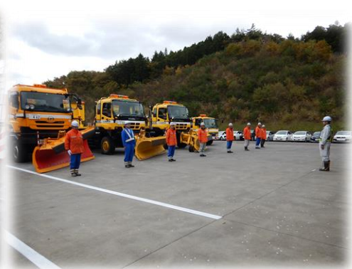
あぶくま高原道路除雪機械出動式