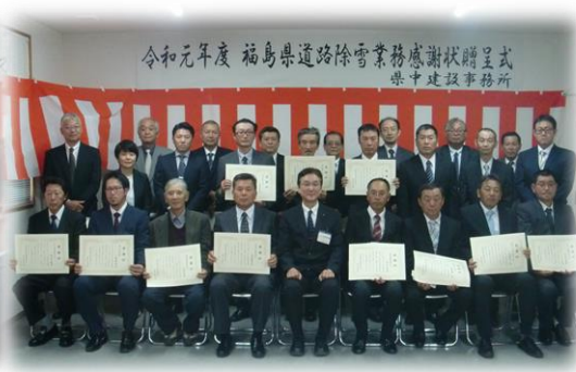
記念撮影（郡山管内）