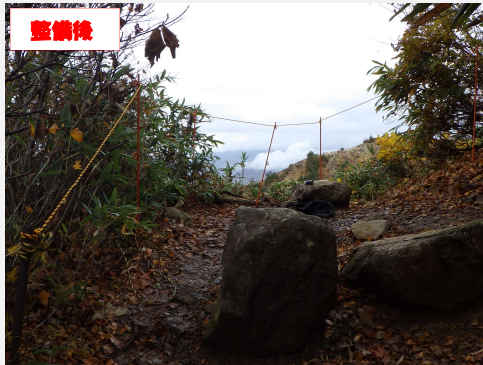
転落防止等のため、ロープ張りを実施しました。