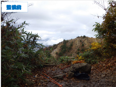
展望スペースの柵が破損し転落の危険性がありました。