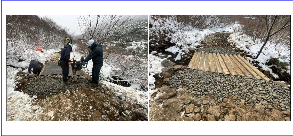
終盤丸太橋改修状況