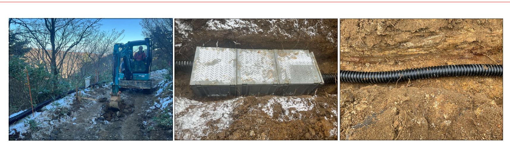
埋設配管敷設・接続ボックス設置作業写真 工事進捗87.8% (配管全長5420mの内4758m施工完了)