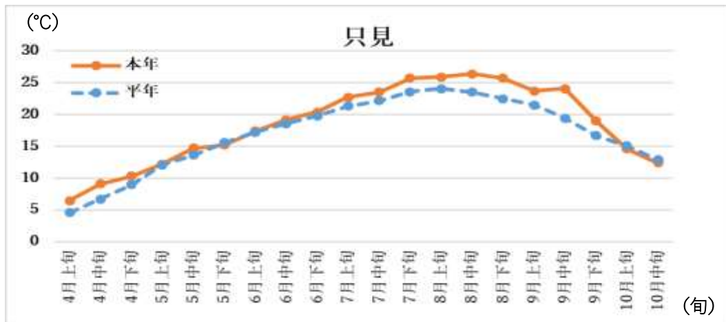
図1 日平均気温 旬別値 (田島・南郷・只見) 気象庁 過去の気象データ・ダウンロードより作成