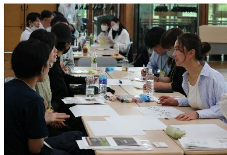
初任者研修の様子