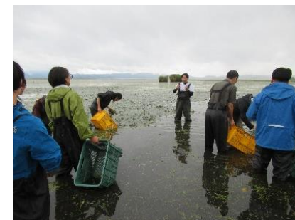
活動支援研修の様子