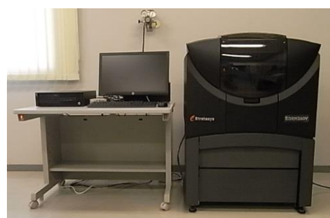
3Dプリンタシステム (モデリングサービス) (3,640円/時間)