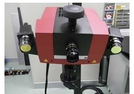
非接触三次元デジタイザ (4,060円/時間)