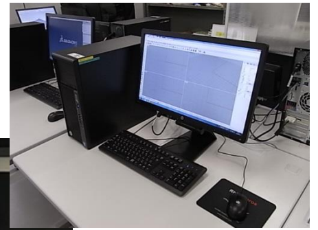
< ②3D CAD >