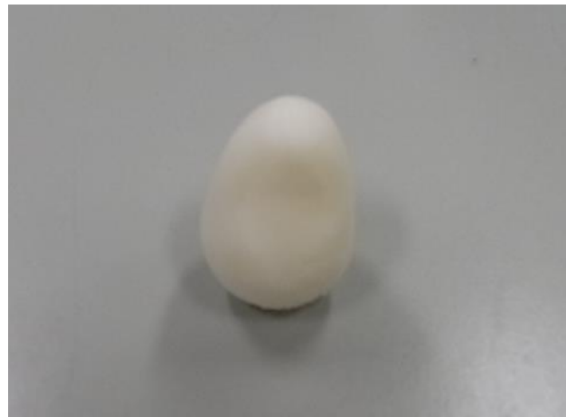
<3Dプリンタ造形例> (右上：モンキーレンチ、右下：ボルト・ナット、左：起上り小法師)

※データはメールまたはCD等のメディアにより受け取れます。(USBメモリ不可) ※造形樹脂の使用料は造形後の造形品をはかりで計測した実重量から算定した料金を後納により申請してもらいます。(10g未満は切り上げ)