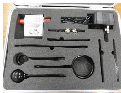
<高周波電磁界センサー>