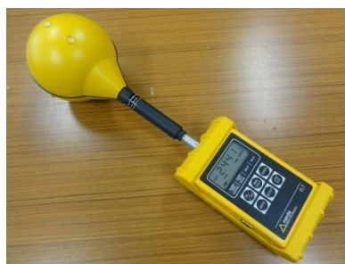
<低周波磁界センサー>