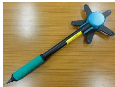
<標準磁界センサー>