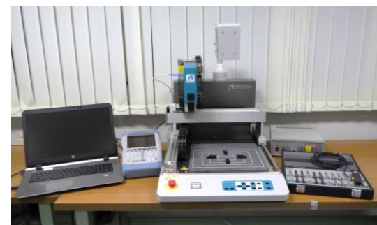
ノイズ源探索装置 (4,050円/時間)