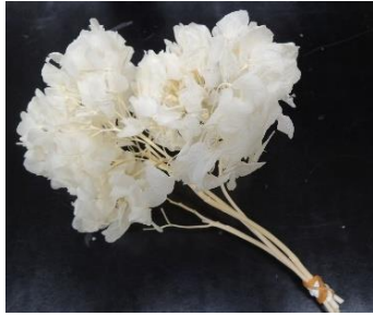
図1 アジサイのドライフラワー