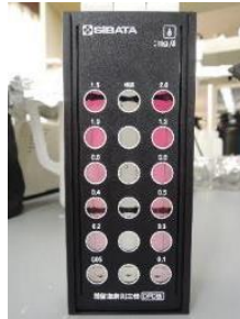
図2 DPD法による測定キット