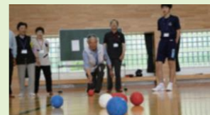
地域の方々とポッチャを体験

山木屋中学校は、今年度学校を再開して2年目となります。特色ある教育活動としては、地域の方々に笑顔にするという目的のもと「笑顔満開プロジェクト2019」を行っています。7月には、地域の方々とパラリンピックの種目であるポッチャに取り組みました。2学期には、山木屋のよさをPRするCMを作り広く発信していく予定です。