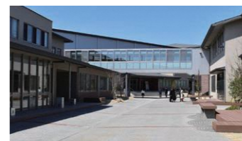
ECC(エデュケーショナル・コンコース) 校門から入ると、街路をイメージした空間が広がります。

平成31年4月8日に、本県2校目となる県立の併設型中高一貫教育校として「ふたば未来学園中学校」が開校しました。建学の精神に「変革者たれ」を掲げ、最先端のカリキュラムを導入し、自ら学び課題を解決できる実践力を育みます。身近な地域を学習フィールドにした探究活動、グローバル・スタディ科による実践的英語力育成、哲学対話・熟議を通しての思考力育成など、特色ある教育を実践します。最先端の設備を備えた校舎や運動施設に加え、遠方から入学する生徒のための寄宿舎も設置し、県内外、そして世界に向けて大きな夢や希望をもって羽ばたく人材の育成に努めます。