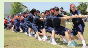
盛り上がりを見せた全員参加の綱引き

学校再開から約1年半が経ち、現在は27名の児童・生徒が学んでいます。少人数をプラスに捉え、三春校とのライブ授業や小・中学校合同行事で同年齢・異年齢の交流を積極的に行っています。また、5月には9年ぶりに町内で運動会を実施し、多くの地域住民が参加するなど、人と人がつながる場としての役割も担っています。