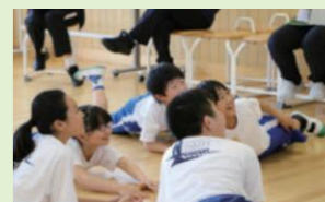
演劇コミュニケーションW.S

児童生徒同士や地域の多様な人々と対話しながら探究する学びで、主体性・協働性・創造性を伸ばす活動を実践しています。演劇コミュニケーションW.S(ワークショップ)や地域の「もの」「ひと」「こと」全てを学びの素材とした「ふるさと創造学」で、自主性/社会性/協働性等、自ら考えてコミュニケーションしようとする力を育てています。