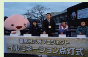
イルミネーション点灯式

「葛尾村元気プロジェクト」として、昨年度は学校の壁面にイルミネーションを設置し、村民や道路を通行する村外の方々に、子どもたちが毎日元気に学校生活を送り、夢の実現に向けて頑張っている姿をアピールしました。