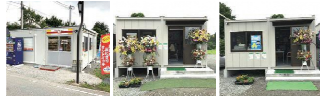
ヤマザキショップ 鈴木商店 たきもとでんき

避難指示区域の一部が解除された大熊町において、令和元年6月、大川原地区に「ヤマザキショップ」「鈴木商店」「たきもとでんき」がオープンしました。これら3店舗は、避難先から町へ戻った住民の方が不自由なく生活できるように、食料品や日用雑貨、電化製品などの販売を行っています。皆さまのご来店をお待ちしております。