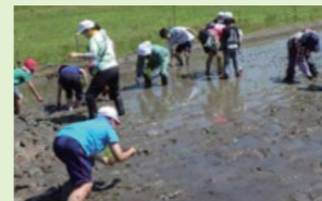
地元農家の方と協力して田植え体験

小学生はふるさと教育の一環として、地元農家、村農政課、ボランティアの方々の協力を得て、飯館村の田んぼで田植えを行っています。今年は晴天のもと、協力者の方々に教えていただきながら丁寧に苗の手植えを行いました。今後も、飯館村ならではの地域に根ざした教育をますます充実させていきます。