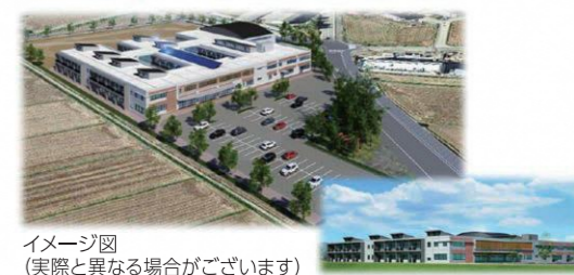
イメージ図 (実際と異なる場合がございます)

現在相馬市にある相馬支援学校は、南相馬市鹿島区に移転新築し、令和2年、新たな環境の下、学校が始まる予定です。福島県の特別支援教育の基本理念である「地域と共に学び、共に生きる教育」を推進するため、在籍する児童生徒をはじめ、地域支援センター「しせい」を中心とし、地域の特別な支援を必要とする子どもたちの就学前から卒業後までにわたる支援を行えるよう、地域になくってはならない学校づくりを目指します。