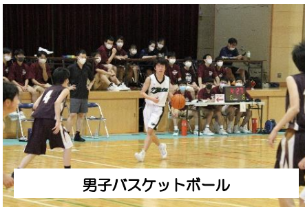
男子バスケットボール

昨年度は、スポーツテストの際に高校生が中学生のテストの補助を行いました。また、日頃の部活動の練習においても田村高等学校の生徒と両中学校の生徒が共に練習を行って技術を高めるなど、高等学校の生徒が中学校へのサポート活動を通して地域連携を実践しています。