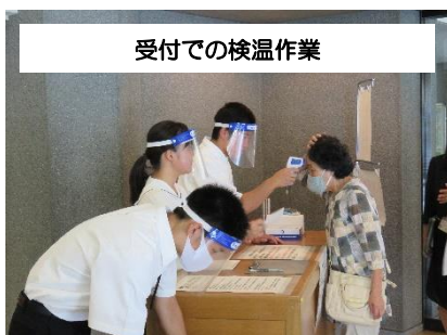
受付での検温作業

三春町議会事務局では、選挙権が18歳に引き下げられたことから、田村高等学校で期日前投票を行っています。若い世代が政治への関心を持つきっかけとなり、議会活動への理解を深めるために「議会一般質問運営参画」を企画し、定例会の運営に田村高等学校の生徒10名が参加しました。当日は、受付での検温や議場への案内を行いました。また、参加した生徒は一般質問の傍聴も体験しました。傍聴者のアンケートには、「高校生の手伝いにとっても好感が持てました。」「高校生の協力はこれからも継続して欲しい。」との温かい声がたくさん寄せられました。