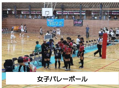
女子バレーボール