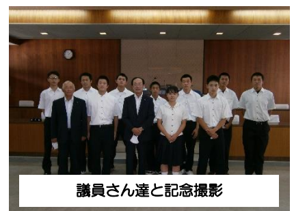
議員さん達と記念撮影