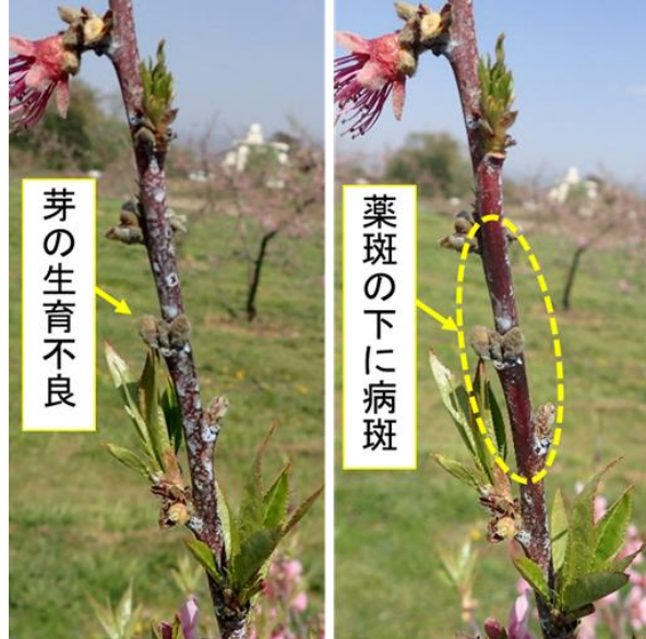
図2 葉斑によって発見困難な病斑