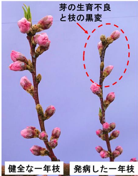
図1 春型枝病斑の特徴