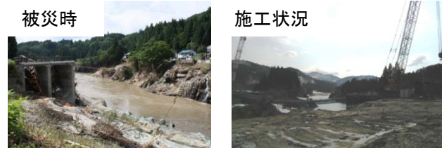
国道252号 二本木橋復旧状況

http://wwwcms.pref.fukushima.jp/pcp_portal/PortalServlet?DISPLAY_ID=DIRECT&NEXT_DISPLAY_ID=U000004&CONTENTS_ID=33256