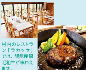
村内のレストラン「ラカッセ」では、飯館産黒毛和牛が味わえます。