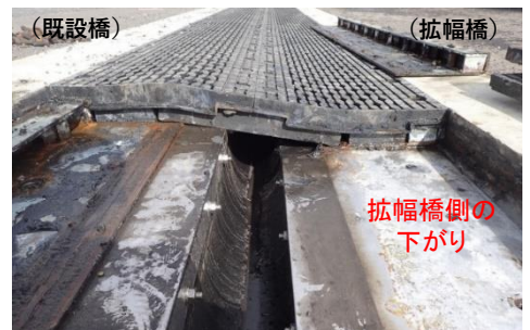
舗装面の段差確認(令和5年10月)