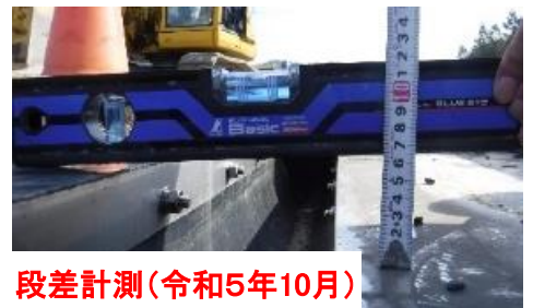
段差計測(令和5年10月)