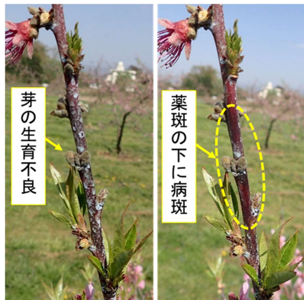
図2 薬斑によって発見困難な病斑