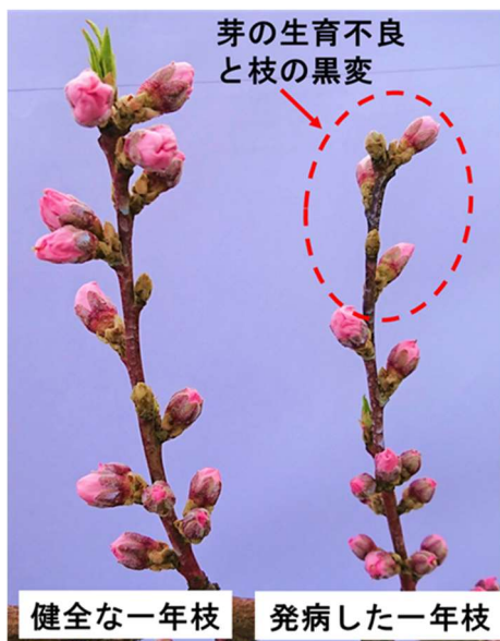
図1 春型枝病斑の特徴