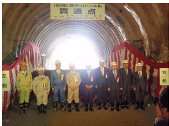
関係者、貫通を祝って。