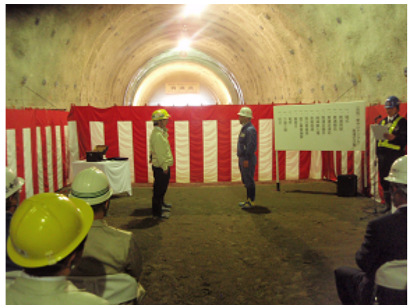
無事貫通した報告です。