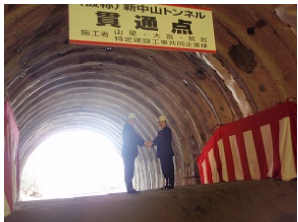
南会津町長と桧枝岐村長の握手が行われました。