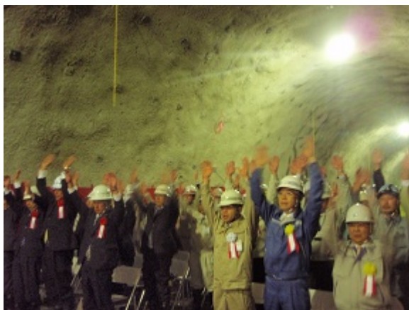
万歳三唱が行われました。