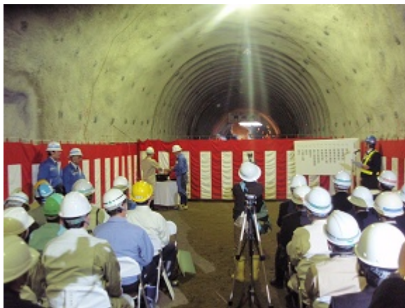
貫通発破が行われました。