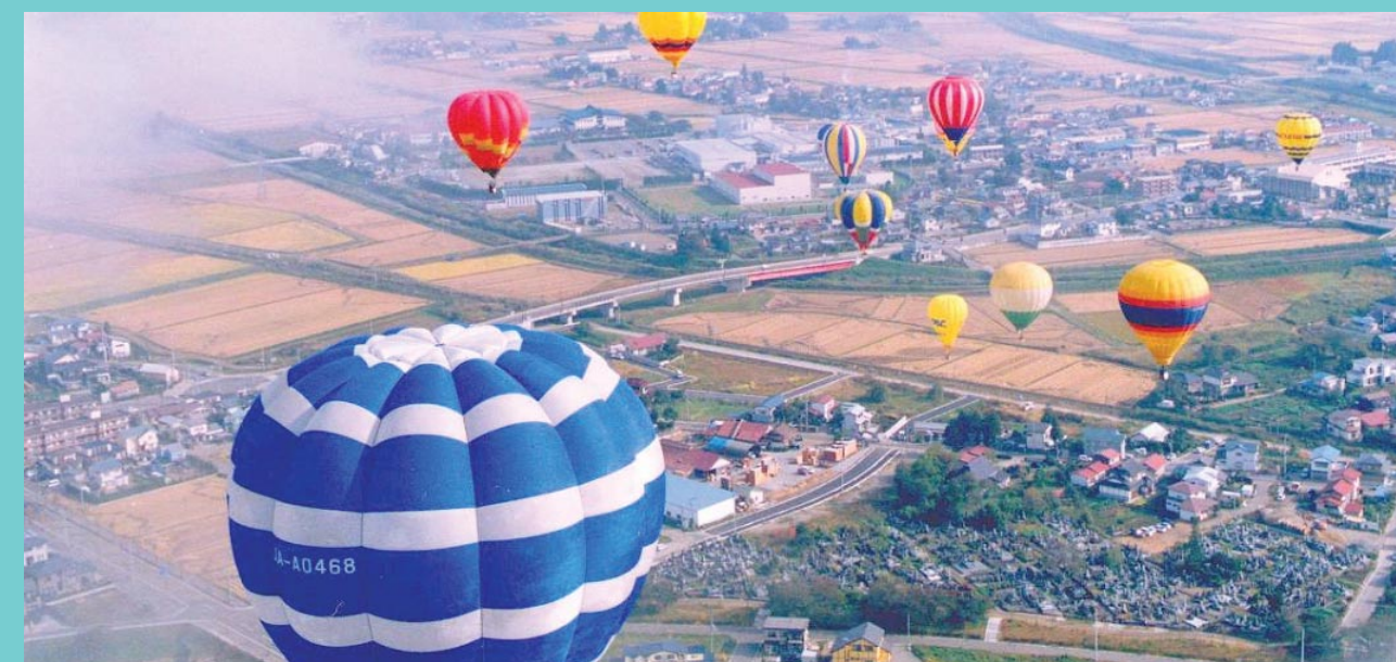
会津塩川バルーンフェスティバル