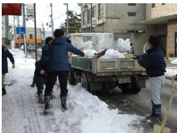
除雪の実施状況です。