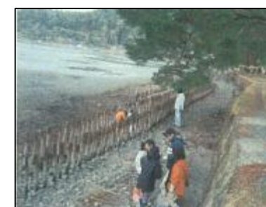
ボランティア清掃の様子