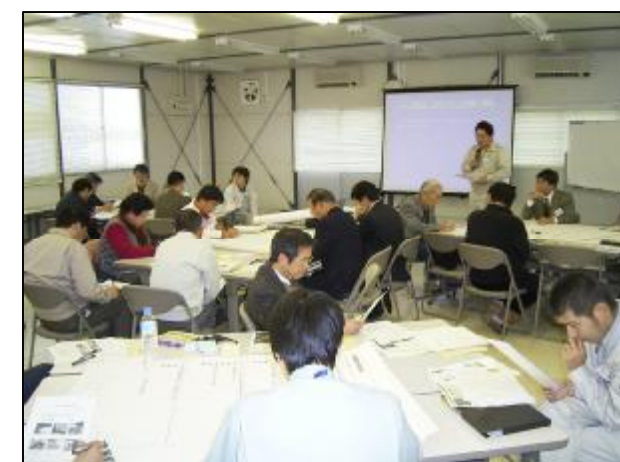
ワークショップでの報告の様子