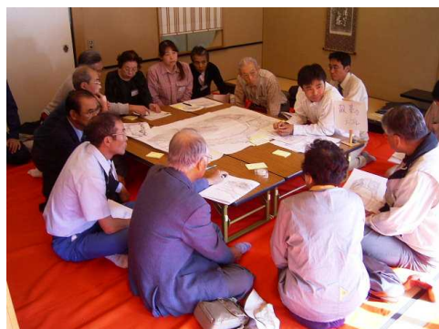
散策ルート等整備プロジェクト