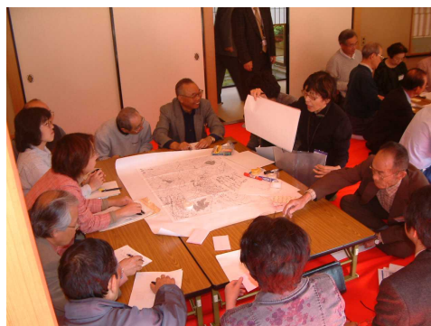
ネットワークづくりプロジェクト