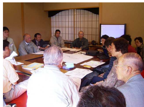
水質浄化対策等プロジェクト