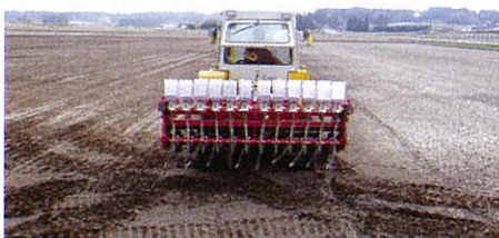
V溝播種機による作業風景

本年は、種籾の温湯消毒等を取り入れ農薬の使用成分を半減し、発酵鶏糞の利用により化学窒素肥料成分を慣行栽培の半分に減らした特別栽培にも取り組んでいます。(農業振興普及部)