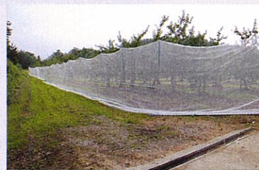
鳥獣害防止用簡易ネット柵の設置状況

そのような事態への対策として、県の農業総合センターで改良された鳥獣害防止用簡易ネット柵を飯館村に設置しました。このネット柵