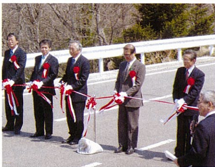
開通式テープカット風景

新地町の鈴宇峠周辺は、既設の林道があったものの幅員が狭く砂利道で車両の走行性が悪いことなどから森林整備に支障をきたして