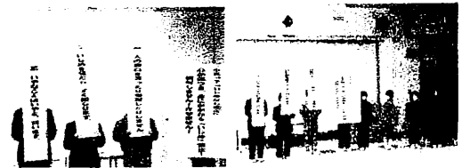
＜全校朝の会（12月8日）での宣言＞