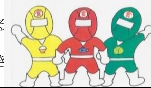
元気戦隊食レンジャー