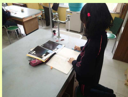
【理科室での学習の様子】

地域スタッフの「子どもたちの成長を見られることが楽しみ」との言葉、元気にあいさつし楽しみながら活動を行う子どもたちの姿がとても印象的でした。また、町担当者の「地域の多くの方々に子ども教室を知っていただき活動に関わってもらえるよう、行政区長等にも依頼をかけて、地域を巻き込んだ事業を展開していきたい」との言葉がとても力強く感じました。