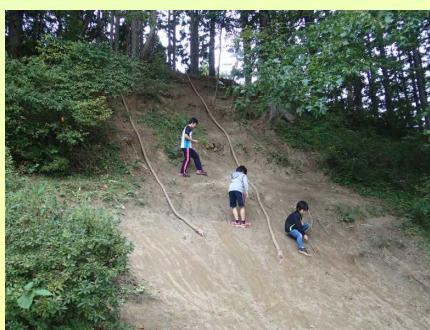
【校庭での運動の様子】