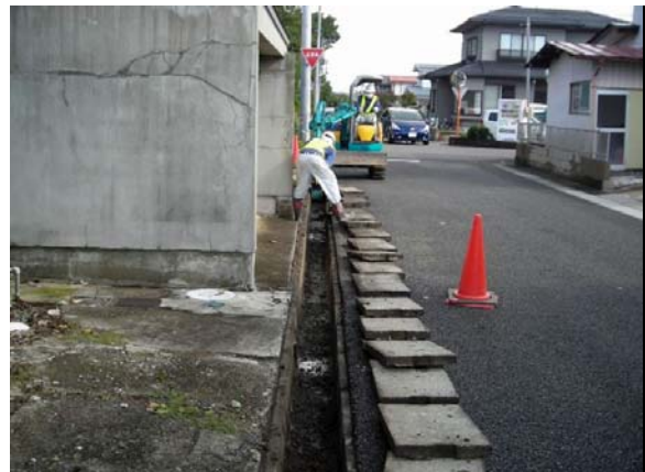
仁井田地区内側溝除染作業