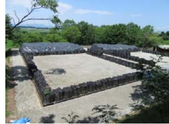
久来石地区仮置場（搬入済）