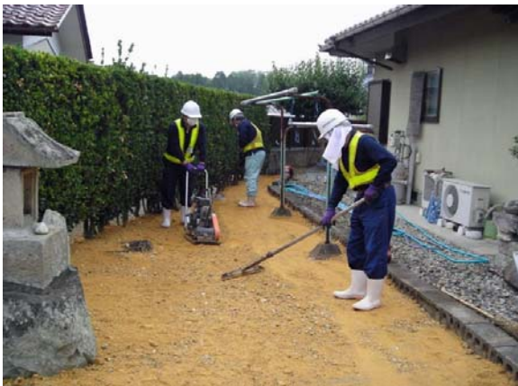
仁井田地区内住宅除染作業