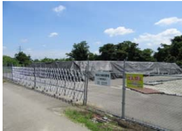
仁井田地区仮置場（搬入済）