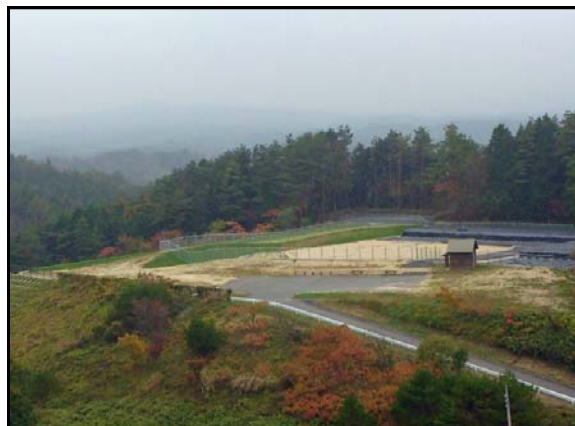
夏井地区仮置場(全景)