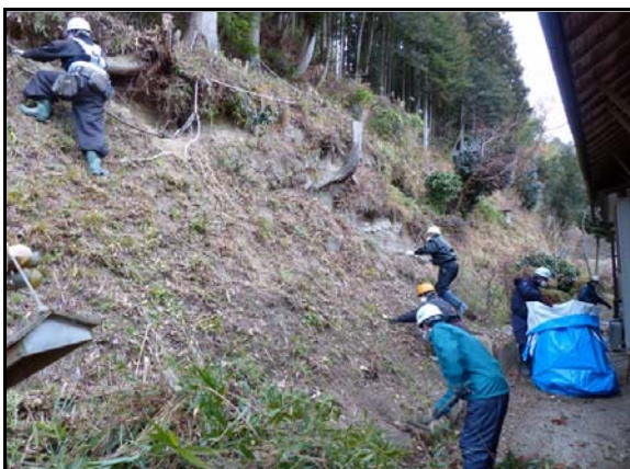
夏井地区除染作業