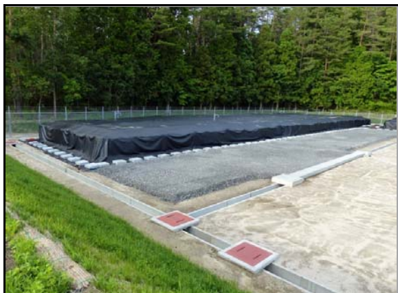
夏井地区仮置場(可燃物)