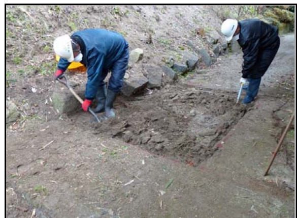
夏井地区除染作業