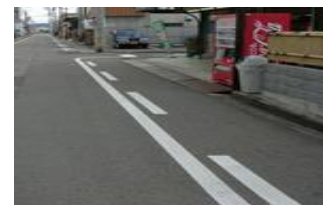
No stopping side strip