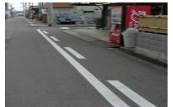
駐停車禁止路側帯