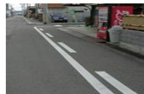
禁止车辆停靠的路缘带