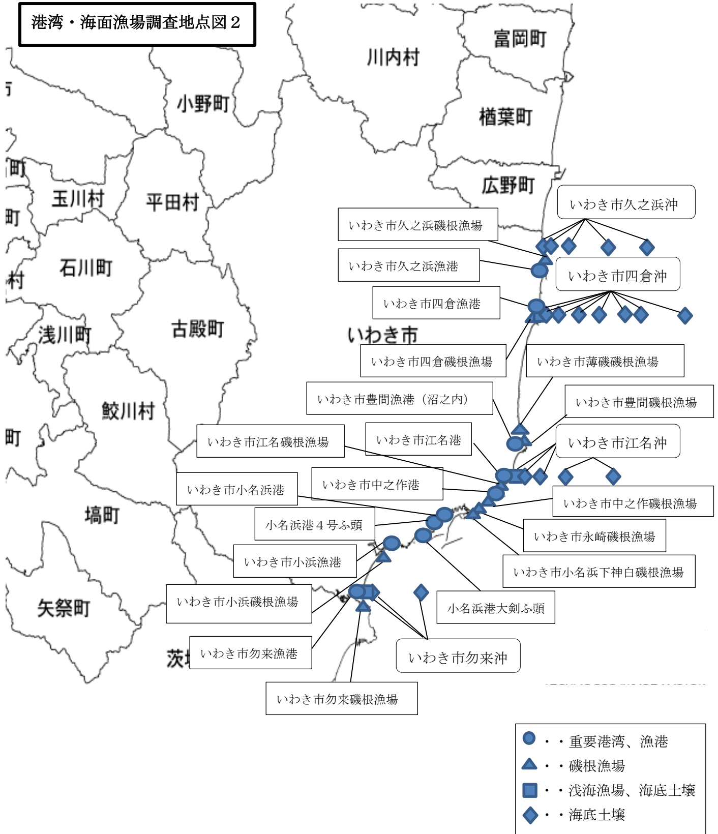
港湾・海面漁場調査地点図 2