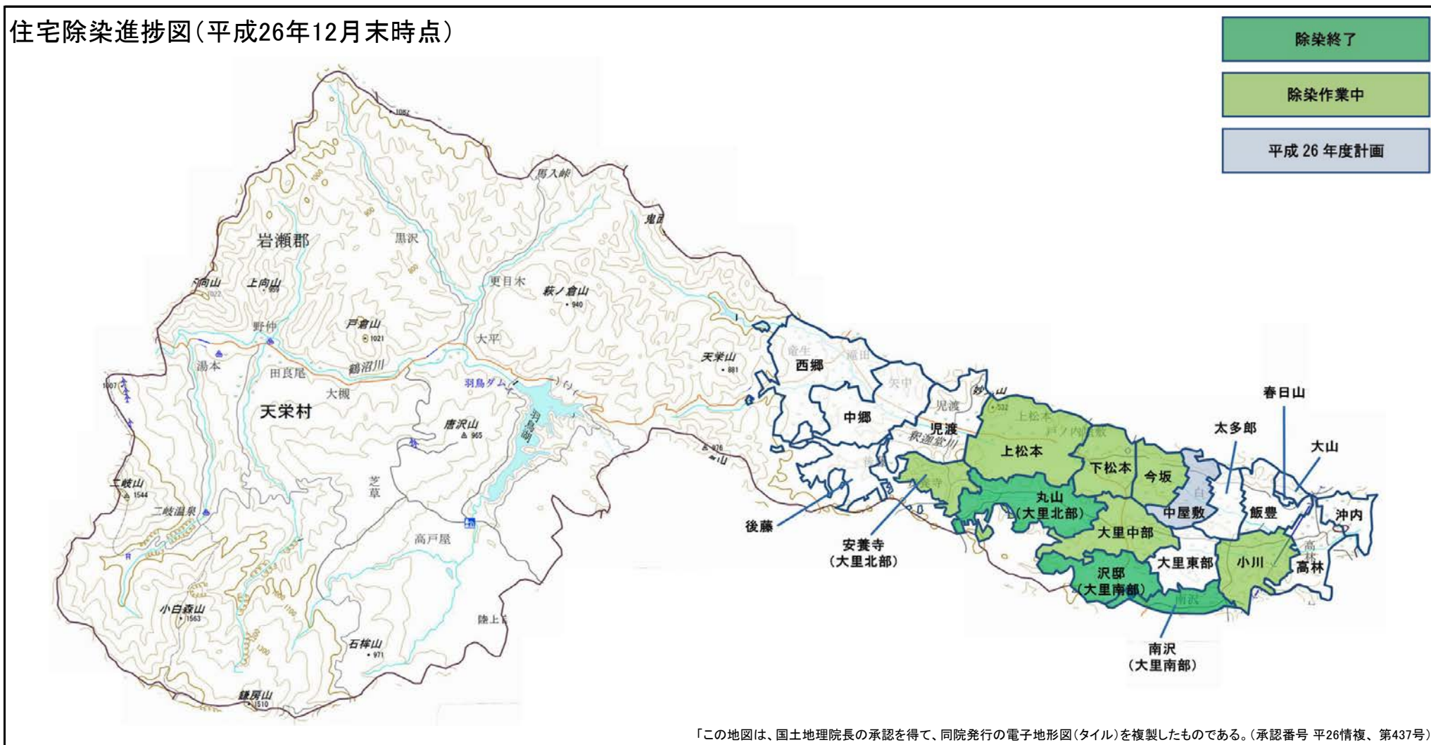
住宅除染進捗図(平成26年12月末時点)