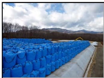
仮置場造成の様子