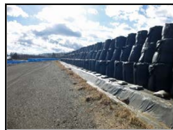
仮置場での保管の様子