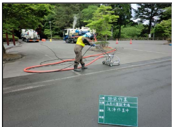
山本公園駐車場除染状況