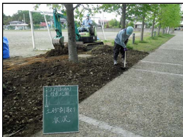
社川小学校除染状況