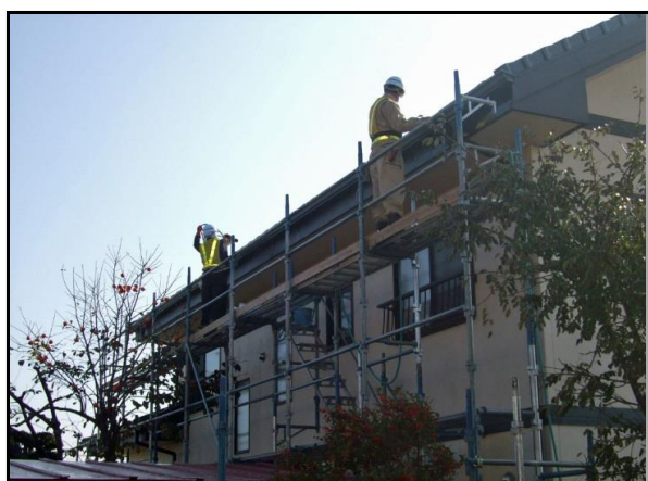
住宅除染実施状況